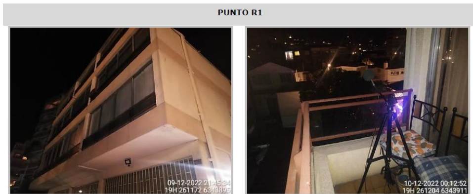
Figura N° 3: Lugar de medición en R1 balcón de departamento