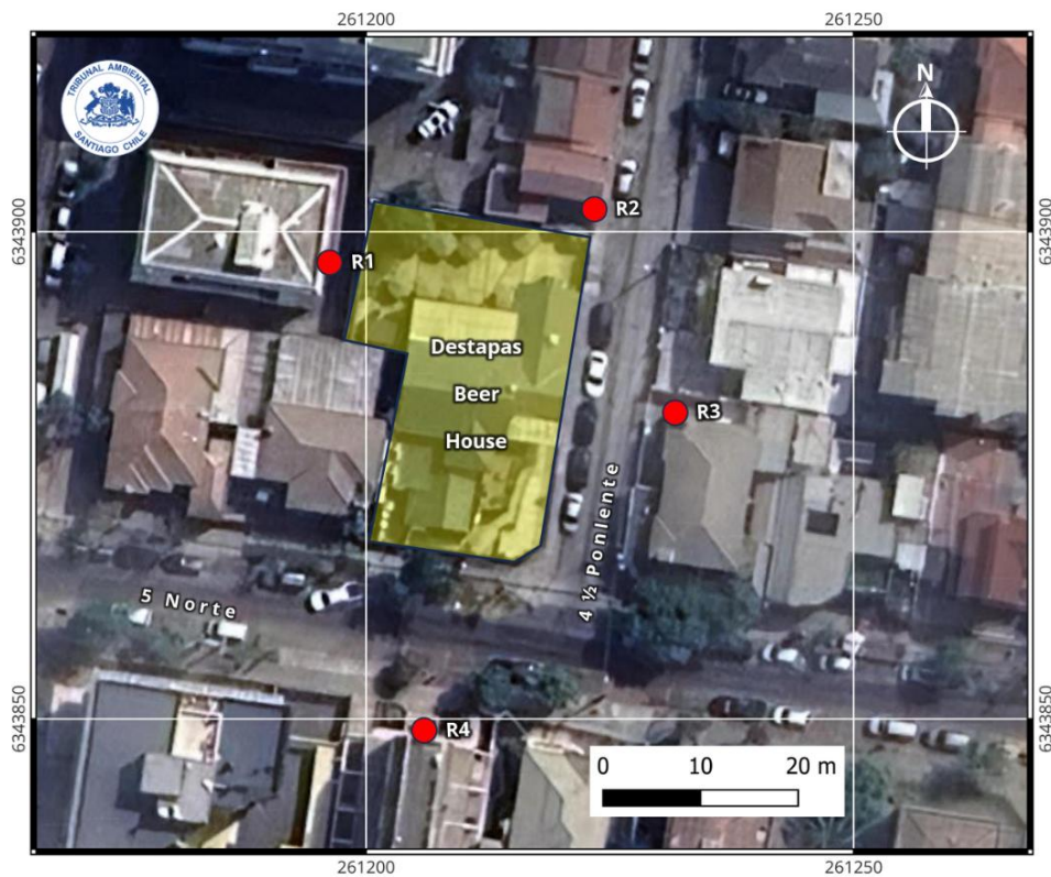
Figura N° 1: Ubicación de la fuente emisora