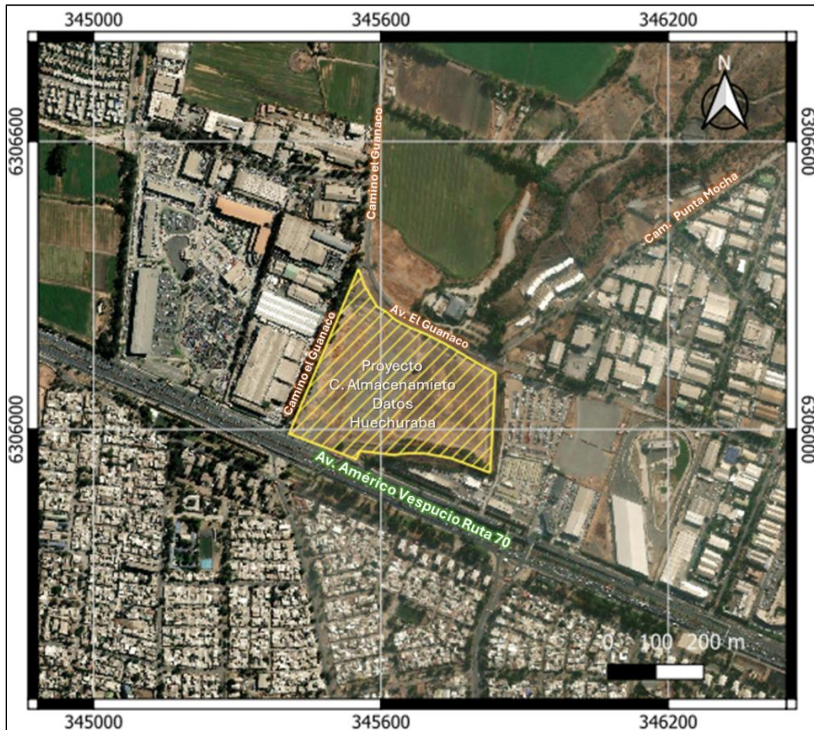
Figura N° 1: Contexto geográfico territorial de la causa

Fuente: Elaboración propia a partir de información contenida en el anexo B de la Declaración de Impacto Ambiental. Cartografía elaborada con software QGIS (versión 3.34/Prizren). SRC: EPSG:32719 WGS 84 / UTM 19S.