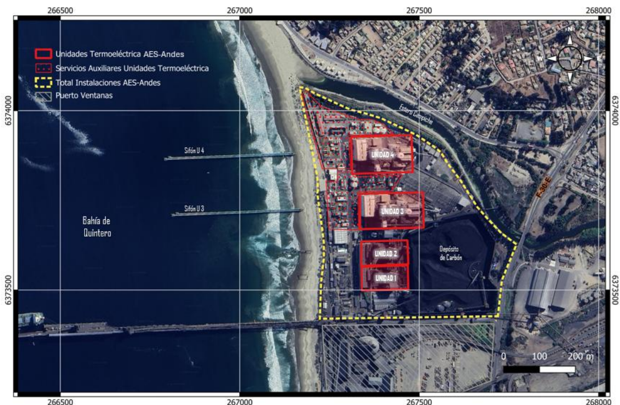
Figura N° 1: Unidades del Complejo Termoelectrico Ventanas

Fuente: Elaboración Segundo Tribunal Ambiental a partir de información disponible en https://quinteroenergia.cl . SCR Cartografía: EPSSG: 32719 - WGS 84/ UTM zona 19 S.