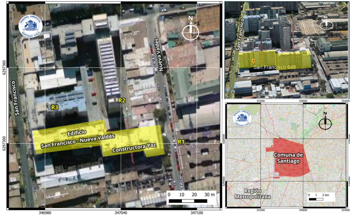
Figura N°1: Ubicación de la fuente emisora y receptores

Fuente: Elaboración propia generada en QGIS 3.32.3 con antecedentes disponibles en el expediente de la causa. SRC WGS84 UTM Zona 19 Sur (EPSG:32719).