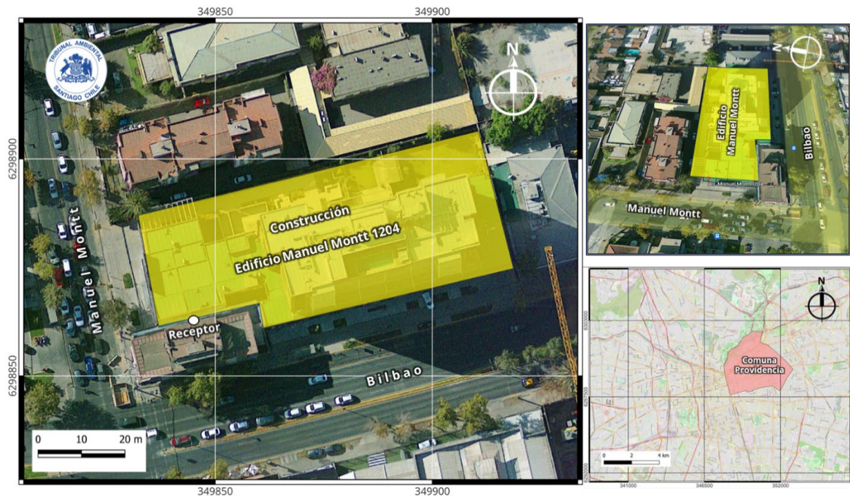
Figura N° 1: Cartografía de contexto territorial de la fuente emisora y del receptor