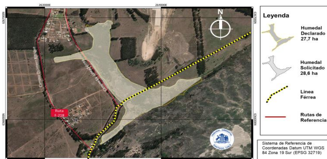
Fig. N° 1. Cartografía Comparativa polígonos Humedal Urbano Los Juanes